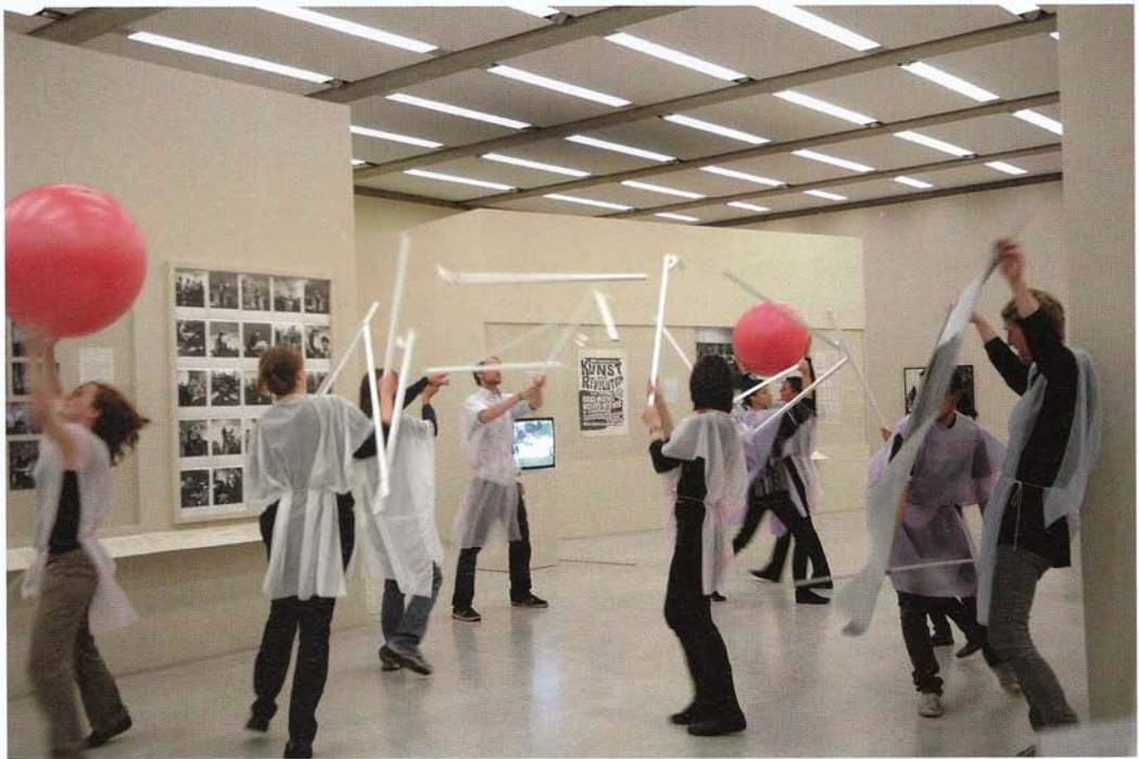
GRAND OPENINGS, CARRIER WAVES, 2008, performance, Museum Moderner Kunst, Vienna / TRÄGERFREQUENZEN, performance

Einige Monate später war ich an der Art Basel zu einem Abendessen eingeladen und aus privaten Gründen furchtbar deprimiert (ich hatte kein Geld, nicht einmal genug, um mir ein Ticket Richtung Heimat zu kaufen). Im Wissen darum, dass ich jemanden würde bitten müssen, mir 60 Euro zu lei-