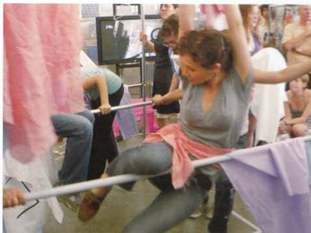
EI ARAKAWA, KISSING THE CANVAS (postponed) , 2008, performance, New Museum, New York / DIE LEINWAND KÜSSEN (verschoben) , Performance.

The first time I met him was on one of those Saturdays that had become more and more determined by administrative activities and, even worse, information-hungry gallery visitors who misunderstood my role of artist/gallerist as that of a kind of information-dispensing grandmother. So one Saturday while I was, as always, fearfully dreading the imminent profession-related questions, I observed in the corner window the presence of someone who surprisingly